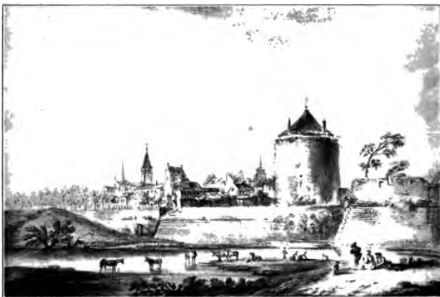
La tour Saint-Nicolas et les remparts, d'après une ancienne estampe.

En rapprochant ces vieux hôtels de pierre des vieilles maisons de bois, et les édifices réservés aux ducs de ceux consacrés à Dieu, c'est le moyen âge qui revit devant nous ; c'est le Vieux-Dijon qui se dégage des brumes du passé, avec sa silhouette de rêve, les flèches aiguës de ses églises, la haute tour du palais de Philippe le Bon, projetée comme par miracle au-dessus de pittoresques toitures. Dans ce cadre merveilleux, la vie des hommes apparaît bruyante et gaie. Rarement l'année se passe,